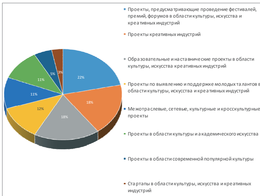
Рис. 1. Типы проектов

Для исследования факторов, определяющих формирование социально-культурного пространства, проанализируем проекты, получившие поддержку в Президентском фонде культурных инициатив, в самом крупном фонде поддержки культуры на примере города Москвы, самого репрезентативного субъекта РФ. Общее количество проектов-победителей по г. Москве по данным конкурсам – 985. Типы проектов представлены на рис. 1.